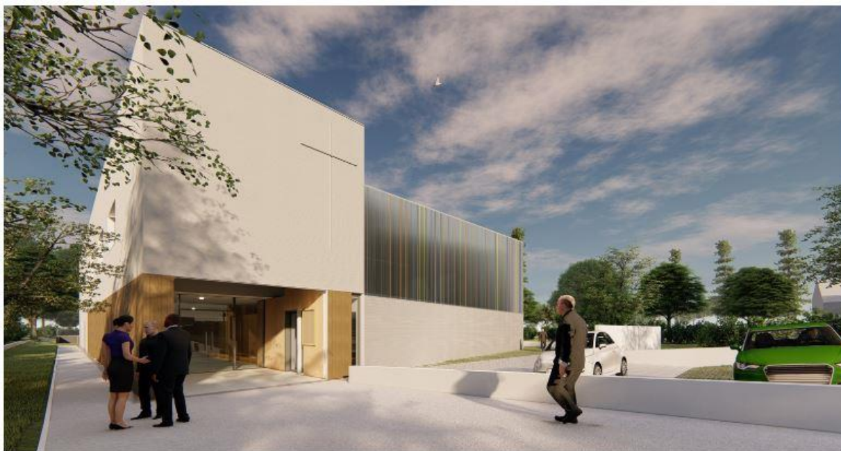
Vue projetée de l'église Saint-Joseph. Une croix présente sur la façade signalera l'édifice catholique.

Les fidèles entrent dans le lieu de culte par un narthex généreux qui s'ouvre à la fois sur la partie communautaire et la nef vitrée ouverte sur un grand jardin. L'église a une capacité de 220 places assises pouvant atteindre 400 places grâce à sa tribune et ses salles de réunion modulables . Nous avons beaucoup travaillé cette idée de modularité et d'ouverture vers l'extérieur. La tribune donne accès à une terrasse qui surplombe le jardin. Il sera même possible d'imaginer des célébrations extérieurs, en miroir du chœur. Au-dessus du narthex se trouvent les salles de catéchisme ainsi qu'un logement pour un prêtre.