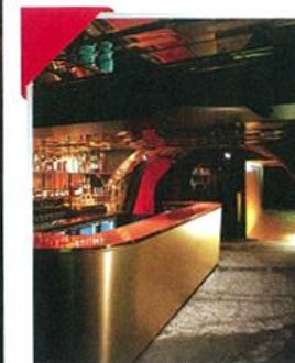
Silencio, 142, rue Montmartre, 75009, Paris. www.silencio-club.com