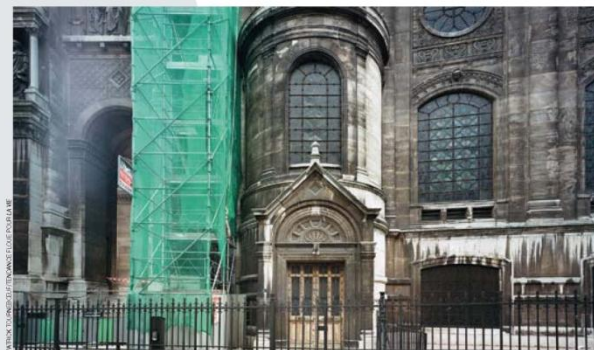
Saint-Augustin est dans « une situation désespérée ». La façade est protégée par un échafaudage.