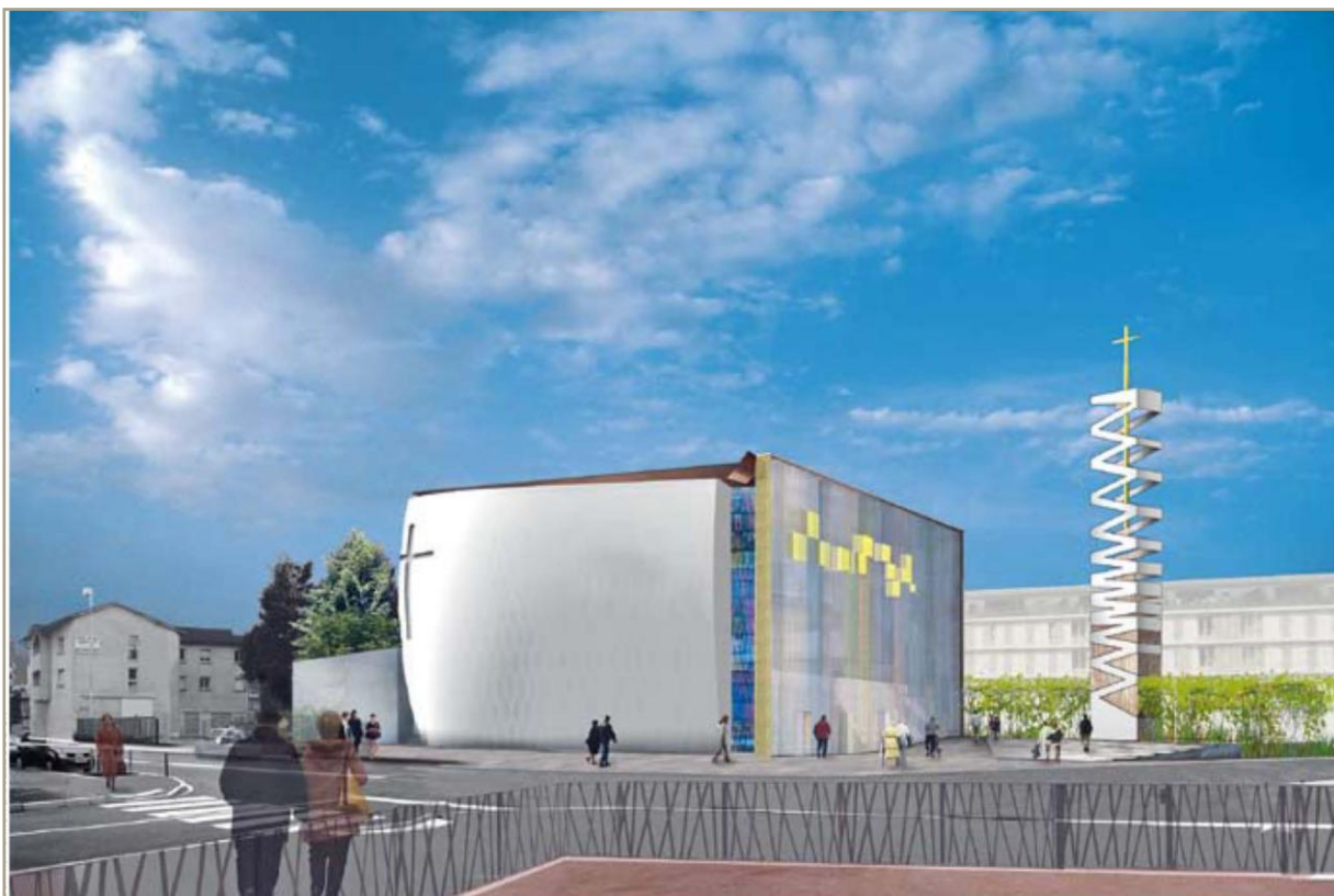
À Vaulx-en-Velin, l'église Saint-Thomas accueillera, entre autres, de nombreux chrétiens irakiens réfugiés en France.

« La relation avec le sacré fascine à peu près tous les architectes, croyants ou non. Le sublime est difficile à créer. Ce qui déclenche l'émotion est impalpable. »