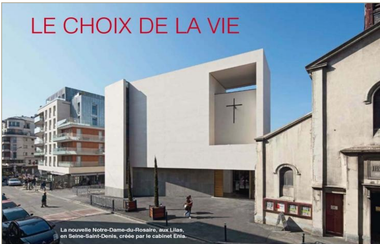
La nouvelle Notre-Dame-du-Rosaire, aux Lilas, en Seine-Saint-Denis, créée par le cabinet Enla.