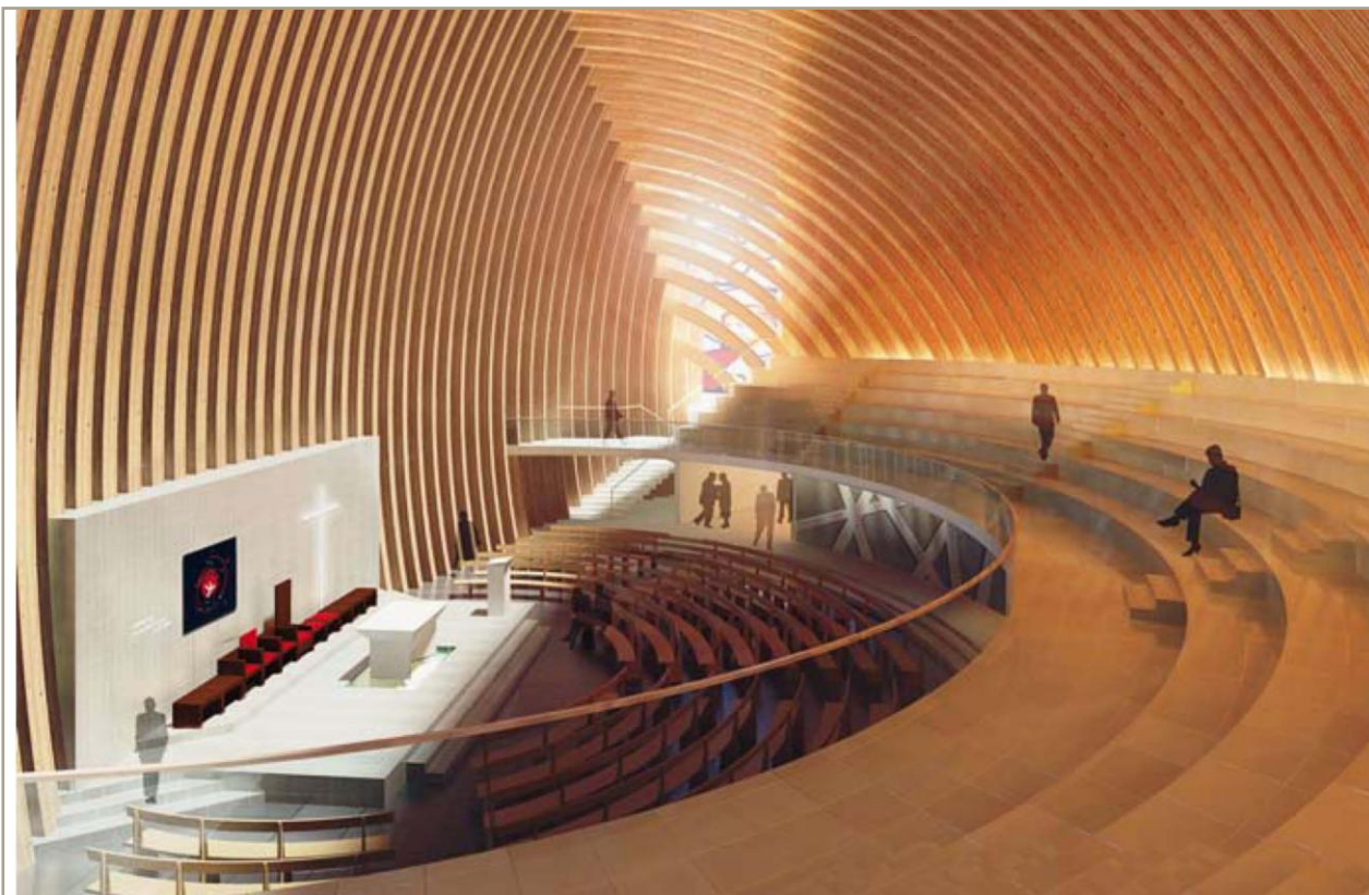
En 2014, la cathédrale de Créteil devrait pouvoir rassembler 1 200 fidèles, une fois sa transformation achevée.

Dame-du-Rosaire, inaugurée en janvier dernier, est un cas un peu particulier. Le nouvel édifice venant remplacer une vieille église, « provisoire » depuis la fin du XIX e siècle, il a en effet été financé, en vertu de la loi de 1905 de séparation de l'Église et de l'État, par la commune.