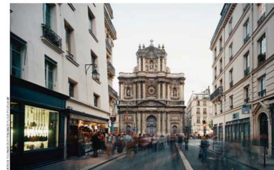
Un des grands travaux programmés : restaurer la façade de Saint-Paul-Saint-Louis.

« La forme des nouvelles églises est résolument contemporaine, quitte à dérouter les fidèles »