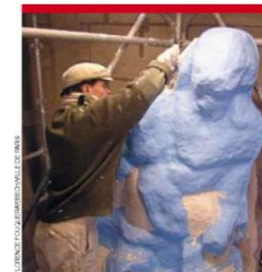
Réfection de la statue de Luc ornant Saint-Sulpice. Une vraie épopée...

■ Chantier de l'église Saint-Thomas à Vaux-en-Velin (69) : aucune visite du site de construction n'est prévue. Mais le chantier est entré dans une phase spectaculaire que l'on peut apprécier depuis l'avenue Picasso.